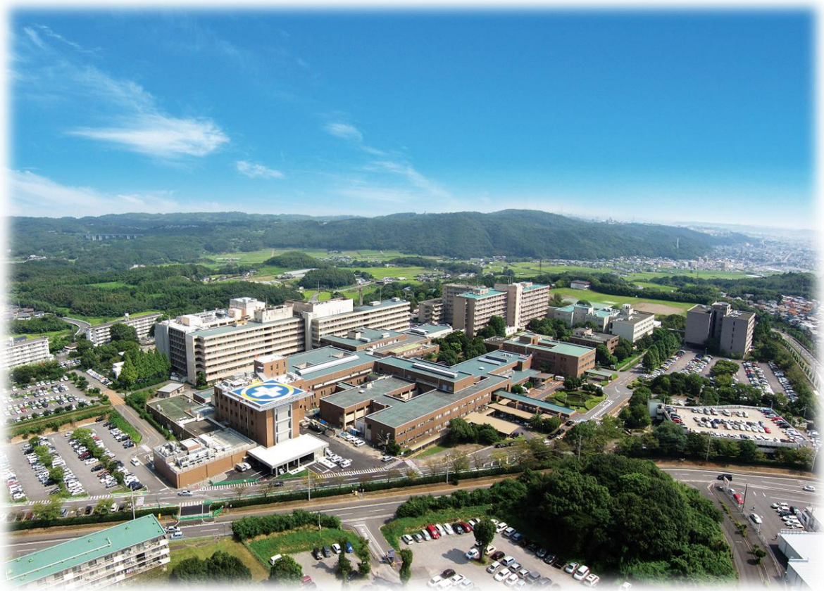
大分大学医学部附属病院 空撮