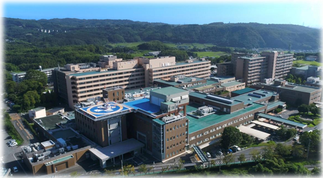
大分大学医学部附属病院 空撮