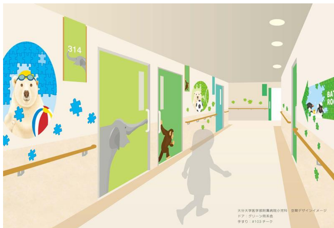
大分大学医学部附属病院小児病棟（2015年リニューアル）