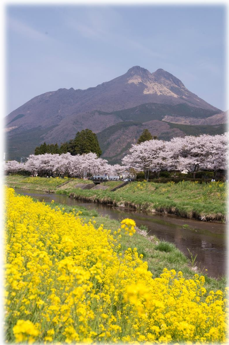
湯布院の春（由布市）